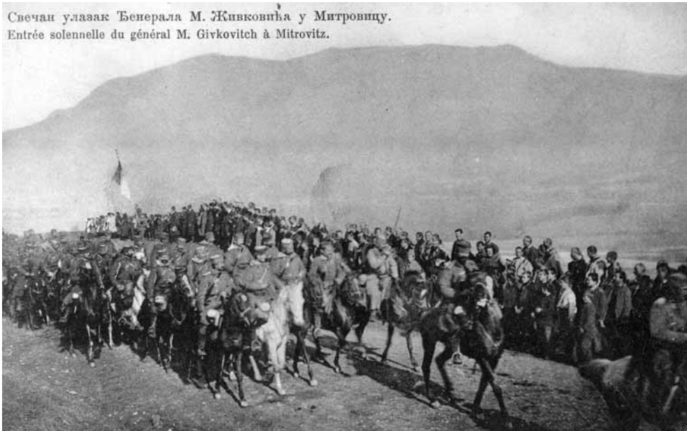
Свечан улазак Генерала М. Живковића у Митровицу. Entrée solennelle du général M. Givkovitch à Mitrovitz.