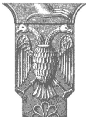
Sl. 5. Dvoglavni orao, Kalenić

Љубомир Стевовић Син хоће да открије” (Лука, 10, 22) и “Ја сам пут и истина и живот; нико не долази Оцу – сем кроз мене” (Јован, 14, 6). Наши преци су у средњем веку врло добро знали које Христос и зато наше владаре из династија Немањића а, Мрњавчевића и Лазаревића на ктиторским композицијама у манастирима увек благосиља Христос Пантократор (С. Радојчић: Портрети српских владара у Средњем веку, Скопље 1934).