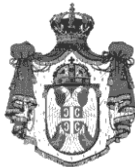
17. Grb Kraljevine Srbije, predlog