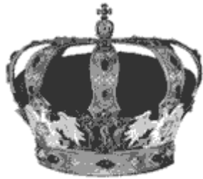
Sl. 8. Kruna kralja Petra I Karađorđevića, 1904

аутентичним споменицима, израђени су сви саставни делови новог грба. Из старе краљевске круне, која је сачувана на толиким новцима, изведена је сведена круна по форми садашњих краљевских круна. По старим аутентичним облицима двоглавога орла узет је на нови грб двоглави орао у полету, и спрам нашег времена узето је натуралистич ко хералдичко цртање... Како се Краљевина Србија развила из Кнежевине Србије, то је државни грб Кнежевине стављен на прси орлу, и задржан је плашт којим се све новије државе у Европи служе и који је већ на грбу Кнежевине Србије усвојен.