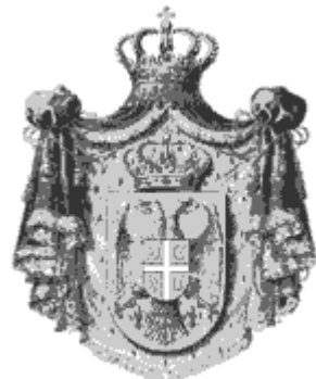
Sl. 2. Grb Kraljevine Srbije 1882-1918

Реакције јавности су углавном биле тројаке: већина је због неинформисаности неопредељена, бивши комунисти су против, јер у томе виде преживеле симболе али нису ништа конкретно предложили, а традиционалисти су за, јер је Србија много дуже била Краљевина него Република.