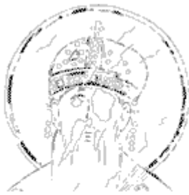
9. Štefan Prvovenčani Žiča 1309 - 1316

За грб Републике Србије је предложен грб Краљевине Србије из 1882. године (слике 2 и 7), који као симболе краљевске власти садржи две хералдичке краљевске круне и краљевски плашт од хермелина. Србија је сада Република и не може да у свом грбу има хералдичке симболе који означавају актуелну краљевску власт. Председници република не носе ни круне ни хермелинске плаштите. Србија увек има право на своје традиционалне симболе. Српска историја и традиција не почињу ни 1941, ни 1904, ни 1882, ни 1815, ни 1804, него од ХИИ века, од Немањића. Три главна српска хералдичка симбола су: