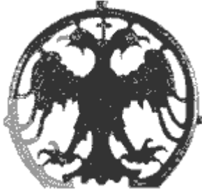
11. Dvoglavi orao Žiča 1309-1316