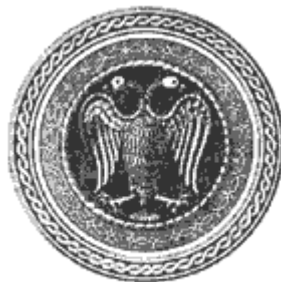
4. Dvoglavni orao, Ljubostinja

Ово владарско апеловање на Бога Оца је настало у XVIII и XIX веку јер је Запад, тонући у материјализам, почео да Христов лик из Еванђеља трансформише у Краља Исуса, и свест о Божанском се постепено сводила на апстрактну представу о Богу Оцу. То наравно не може да издржи православну критику, јер: “Бога нико никад није видео, јединородни Син који је у наручју Оцином, он га јави” (Јован 1, 18), “Мој Отац ми је све предао. И нико – сем Оца – не зна ко је Син, и ко је Отац – зна само Син и онај коме 40