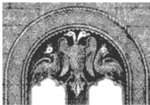
Sl. 3. Dvoglavni orao, Lazarica

Почетком XX Европу су сачињавале старе апсолутистичке монархије, са феудалним поретком и добро разрађеном хералдиком. Државни грбови су се састојали од круне владара и хермелинског огртача који закриљује штит са хералдичким симболима. Ретко која монархија је до средине XX века имала устав, јер је владар поседовао неограничену власт. Сходно томе, химне су имале династички а не народни карактер. Најчешће почињале са “Боже, чувај краља или цара”, већ према томе ко је био на челу државе.