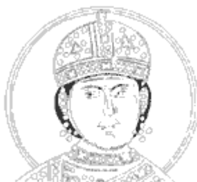
10. Kralj Radoslaw Žiča 1309-1316

1402. После пада Српске средњовековне државе представља грб Српског народа у најширем смислу. У нашој хералдици се овај грб скраћено зове “Српски штит”, а сам симбол крста са четири “слова”, уколико није на штиту, зове се “Српски тетраграм” (слика 6).